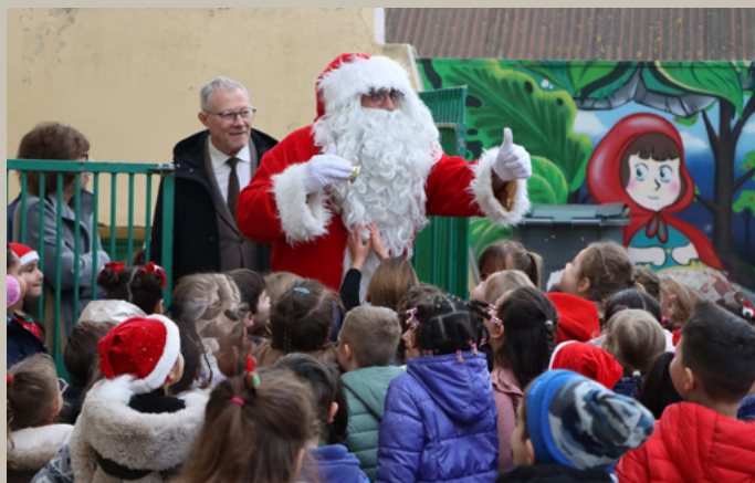
VISITE DU PÈRE NOËL DANS LES ÉCOLES