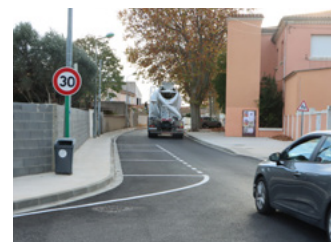
Aménagement voirie Chemin des Moutiers