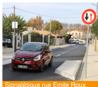
Signalétique rue Emile Roux

Ces réalisations ne sont pas seulement des chantiers ; elles représentent un investissement pour l'avenir, au service d'une ville plus harmonieuse, plus accessible, et tournée vers le bien-être de tous.