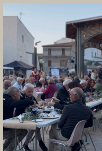
FÊTE DES VENDANGES