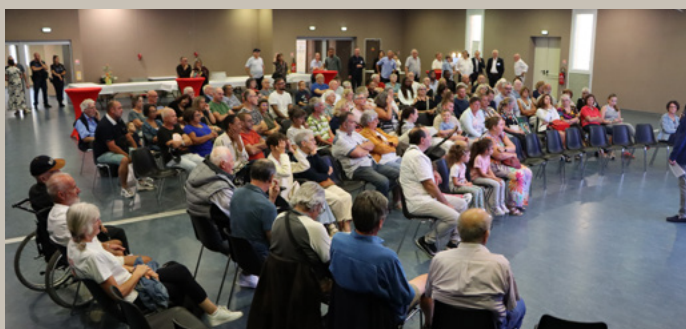
ACCUEIL DES NOUVEAUX LEZIGNANAIS