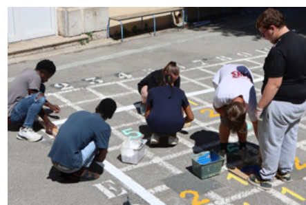
Chantier pour la Coopérative Jeunesse de Service 2025 ... travaux de peinture à l'Ecole Alphonse Daudet à la demande de la Ville de Lézignan-Corbières

Après une année de pause, la MJC a réactivé son opération de Coopérative jeunesse de services. Destinée aux jeunes à partir de 16 ans, elle a pour but de les initier au monde du travail dans une démarche d'entrepreneuriat. La Mairie participe en faisant appel aux jeunes dans le cadre de ses actions citoyennes.