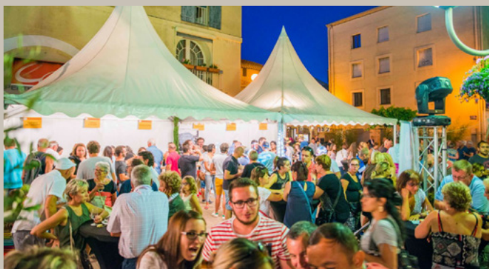
CORBIÈRES EN FÊTE