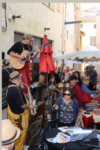
ANIMATION DU MARCHÉ EN ÉTÉ