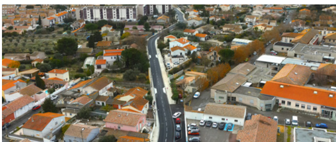
Boulevard Emile Roux

Ces interventions, réparties dans l'ensemble de la ville, traduisent une volonté forte de moderniser les infrastructures tout en répondant aux besoins exprimés par les habitants. Réfection de voiries, création de cheminements piétons adaptés, mise aux normes des équipements, amélioration de l'éclairage public, renforcement de la signalisation... autant d'actions concrètes qui contribuent à rendre Lézignan-Corbières plus accueillante, plus inclusive et plus sûre.