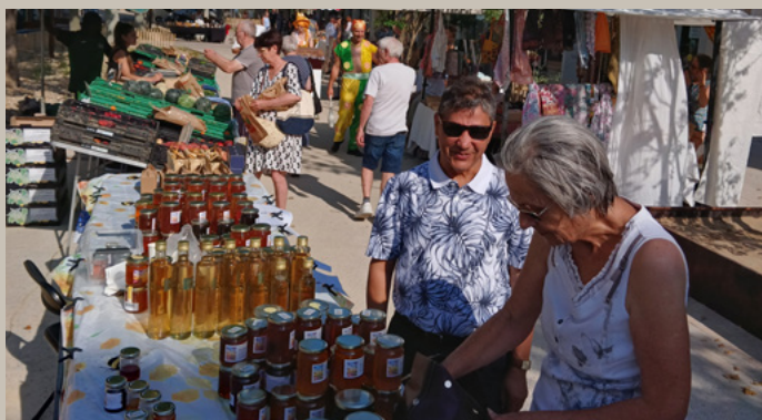
MARCHÉ DU SAMEDI MATIN