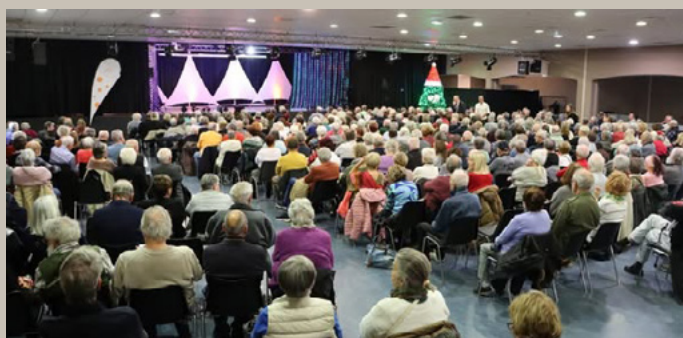
SPECTACLE DE NOËL POUR NOS AÎNÉS