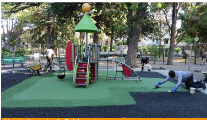
Aire de Jeux - Jardin Public

Lors des derniers mois, la ville a engagé une série de travaux essentiels pour améliorer durablement le quotidien de chacun. Fidèle à ses engagements, la municipalité poursuit une politique active en faveur de la mobilité, guidée par deux priorités essentielles : l'accessibilité pour tous et la sécurité des espaces publics.